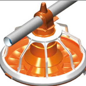
8 brazos, plato 14"