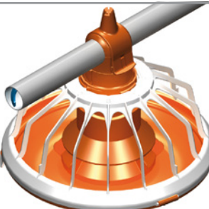
16 brazos, plato 14"