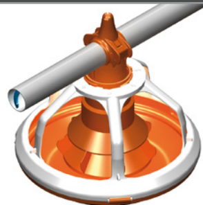
5 brazos, plato 13"

Cada plato tiene un borde protector que reduce caídas de alimento junto con aletas que evitan que las aves desperdicien el mismo, y la rotación de 360° del comedero asegura la distribución uniforme del alimento.